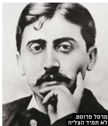
מרסל פרוסט. לא תמיד הצליח

צרפת לטירוף. היא הופכת לנשיאת הרפוב' ליקה הצרפתית". הספר, שכולל 450 איורים צבעוניים, יהיה בן 670 עמודים. "כשכתבתי את 'פשרות אנוכיות' הגיעה לחיי אותה חתולה שהפכה לחשובה מאוד בקיום שלי", מספר כהן. "החתולה הזו לי"